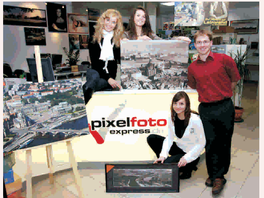
Dresden-Motive in allen Formaten, besonders edel auf Leinwand, besonders schnell bei PixelfotoExpress

Wer die Oma gern mit einem selbst gestalteten Fotokalender er-